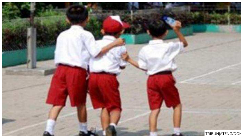
ILUSTRASI SISWA SD.

TRIBUNJATENG.COM, JAKARTA - Pandan College menggelar program pemberian beasiswa sebagai bentuk tanggung jawab sosial kemasyarakatan atau kerap disebut CSR.