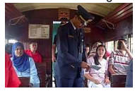
Ratusan Kolam Tinja Ancam Keselamatan KA Ambarawa-Kedungjati

/5.Kuliner.Aceh.Wajib.Coba) ( http://travel.kompas.com/read/2014/12/15/113300627 ) /Warung.di.Gili.Trawangan.yang.Mendunia) ( http://travel.kompas.com/read/2014/12/30/130700827 )