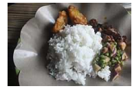
Warung di Gili Trawangan yang Mendunia

/5.Kuliner.Aceh.Wajib.Coba) ( http://travel.kompas.com/read/2014/12/15/113300627 ) /Warung.di.Gili.Trawangan.yang.Mendunia) ( http://travel.kompas.com/read/2014/12/30/130700827 )