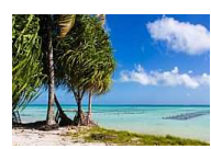
Wah, Negara yang Paling Sedikit Dikunjungi Turis Ternyata Sangat Cantik

( http://travel.kompas.com/read/2014/12/17/160900127 ) /Wah.Negara.yang.Paling.Sedikit.Dikunjungi.Turis.Ternyata.Sangat.Cantik) ( http://travel.kompas.com/read/2014/12/17/160400227 )