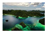
Pelni Tawarkan Tur ke Raja Ampat dengan Harga Terjangkau

/Bule.atau.Bukan.Pencuri.di.Trawangan.Pasti.Diarak.Keliling.Kampung) ( http://travel.kompas.com/read/2014/12/17/120300227 ) /Pelni.Tawarkan.Tur.ke.Raja.Ampat.dengan.Harga.Terjangkau)